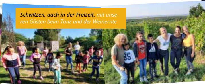
Schwitzen, auch in der Freizeit, mit unseren Gästen beim Tanz und der Weinerle