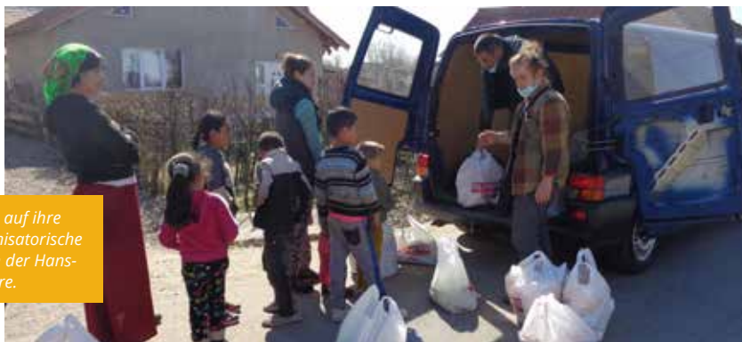
Frauen und Kinder warten auf ihre Lebensmittelpakete. Organisatorische Starthilfe erhielten wir von der Hans-Linder-Stiftung in Satu Mare.

Wir bedanken uns bei allen Spendern in Rumänien und Deutschland, die uns die Nothilfe ermöglicht haben!