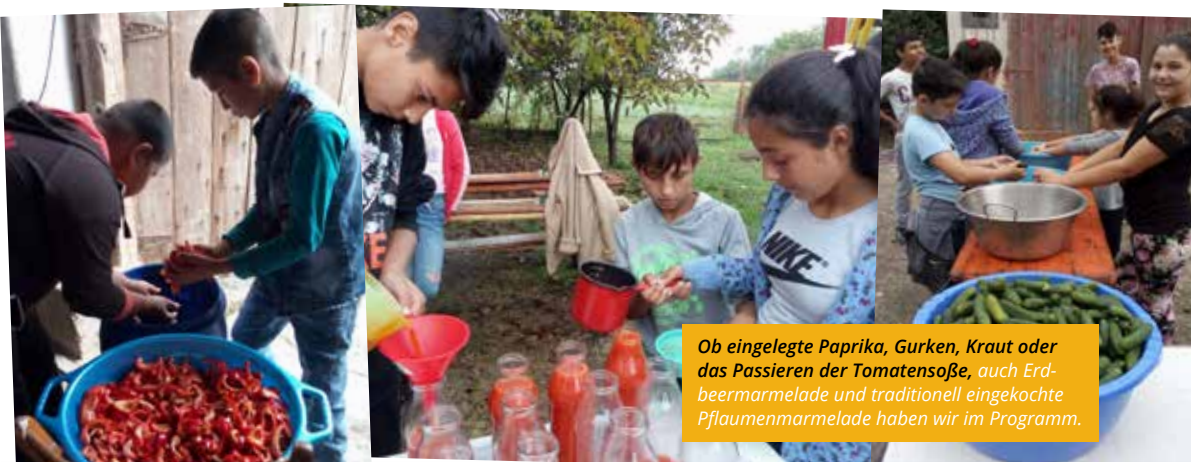
Ob eingelegte Paprika, Gurken, Kraut oder das Passieren der Tomatensoße, auch Erdbeermarmelade und traditionell eingelegte Pflaumenmarmelade haben wir im Programm.