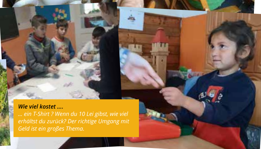
Wie viel kostet .... ... ein T-Shirt? Wenn du 10 Lei gibst, wie viel erhältst du zurück? Der richtige Umgang mit Geld ist ein großes Thema.