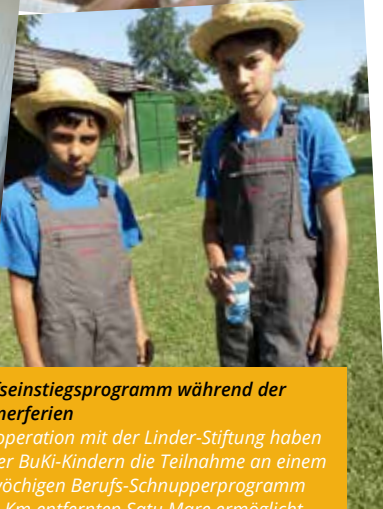
Berufseinstiegsprogramm während der Sommerferien In Kooperation mit der Linder-Stiftung haben wir vier BuKi-Kindern die Teilnahme an einem zweiwöchigen Berufs-Schnupperprogramm im 40 Km entfernten Satu Mare ermöglicht.