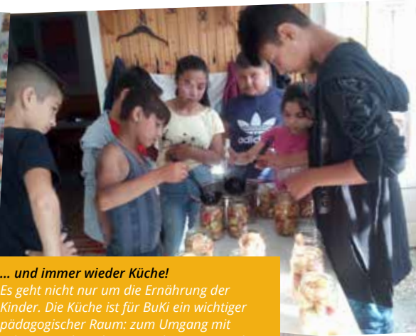
... und immer wieder Küche! Es geht nicht nur um die Ernährung der Kinder. Die Küche ist für BuKi ein wichtiger pädagogischer Raum: zum Umgang mit Lebensmitteln, Arbeiten nach Rezepten - dazu muss man verstehen was Milliliter und Kilogramm sind, gleichzeitig erhalten die Kinder einen Eindruck von der grandiosen Vielfalt an Gerichten und Zubereitungsmöglichkeiten.