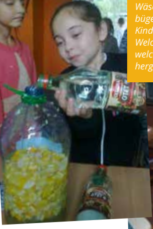
Beim Bügeln konnten die Jungs zeigen was sie drauf haben! Wäsche waschen, Wäsche aufhängen, Wäsche bügeln und aufräumen, wo sollen es die Kinder lernen, wenn nicht bei BuKi. Welche Reinigungsmittel verwendet man für welchen Zweck? Können Allzweckreiniger selbst hergestellt werden? Ganz einfach sogar.