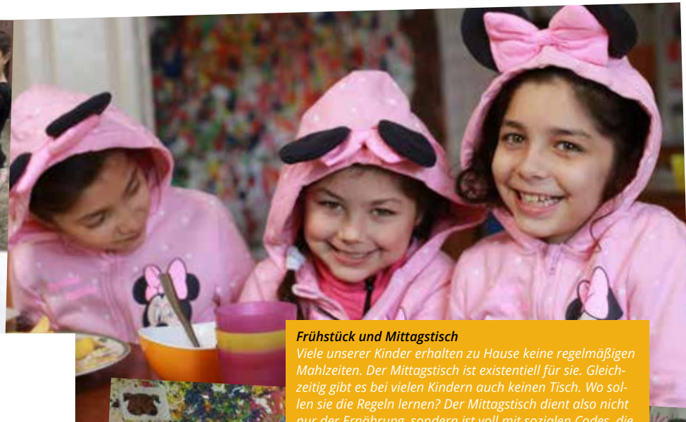
Frühstück und Mittagstisch Viele unserer Kinder erhalten zu Hause keine regelmäßigen Mahlzeiten. Der Mittagstisch ist existentiell für sie. Gleichzeitig gibt es bei vielen Kindern auch keinen Tisch. Wo sollen sie die Regeln lernen? Der Mittagstisch dient also nicht nur der Ernährung, sondern ist voll mit sozialen Codes, die für die Zukunft der Kinder wichtig sind.