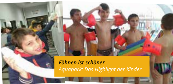
Föhnen ist schöner Aquapark: Das Highlight der Kinder.